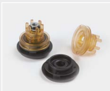
自動車用途向けバルブユニット