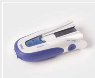
民生品向け安心溶着