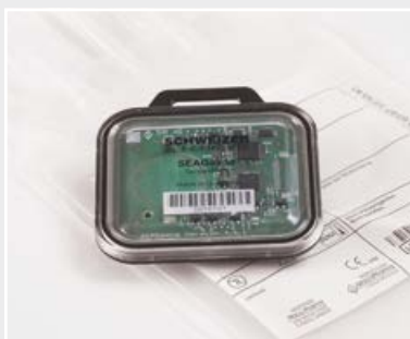
組み込みセンサーシステム付きの丈夫な RFID 受信機