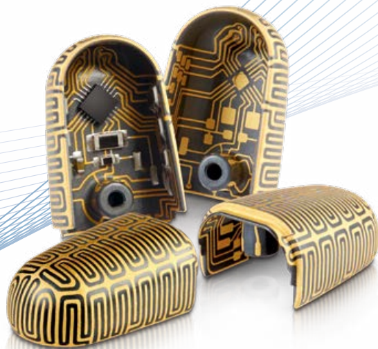
ロボットハンド用タッチセンサー