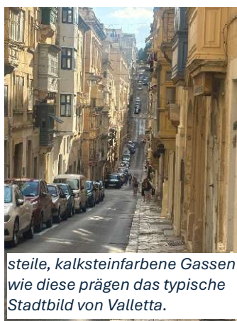
steile, kalksteinfarbene Gassen wie diese prägen das typische Stadtbild von Valletta.