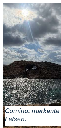
Comino: markante Felsen.