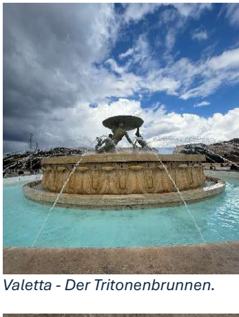
Valetta - Der Tritonenbrunnen.

In unserer Freizeit nutzten wir die Zeit, um Malta zu erkunden. Wir besuchten unter anderem die Hauptstadt Valletta sowie die berühmte Blaue Lagune auf Comino . An freien Vormittagen genossen wir das sonnige Wetter, gingen brunchen oder verbrachten Zeit am nahegelegenen Strand. Dank der kompakten Größe der Insel war vieles gut zu Fuß, mit dem Bus oder der Fähre erreichbar .