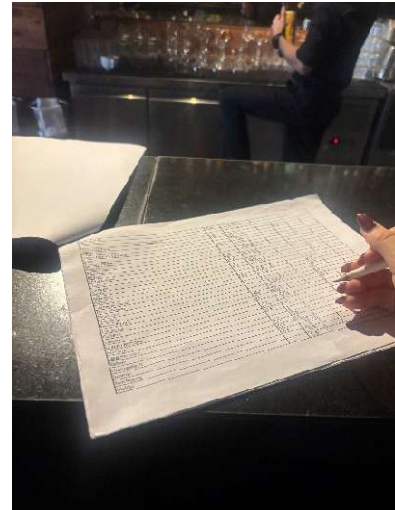
Inventur des Getränkebestandes

In der zweiten Woche durften wir verantwortungsvollere Aufgaben übernehmen. Dazu gehörte das Arbeiten mit dem Kassensystem zur Bestell- und Zahlungserfassung sowie die Unterstützung bei der Inventur der Getränke . Mit der Zeit lernten wir immer mehr Kolleginnen, Kollegen und Stammgäste kennen, wodurch die Arbeit zunehmend vertrauter wurde. Besonders betont wurde im Betrieb die Bedeutung von Professionalität , also ein stets freundliches Auftreten, gepflegtes Erscheinungsbild, aufrechte Haltung und Aufmerksamkeit im Umgang mit Gästen .