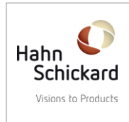
Hahn-Schickard (Deutschland) www.hahn-schickard.de