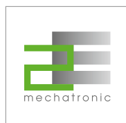
2E mechatronic (Deutschland) www.2e-mechatronic.de