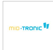
MID-TRONIC Wiesauplast GmbH (Deutschland) www.mid-tronic.de