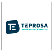
TEPROSA GmbH (Deutschland) www.teprosa.de